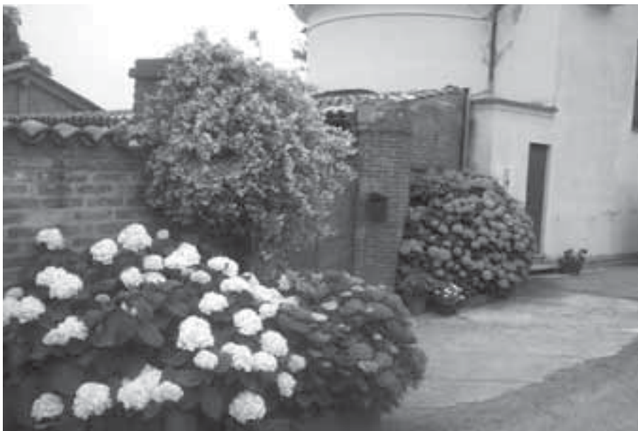
Uno scorcio fiorito di Coppi, frazione di Cella Monte, visitata dalla giuria di Entente florale

E lusinghiere sono state le dichiarazioni del presidente della giuria, l'inglese Terry Whitmill, membro della Royal Horticulture Society, in occasione della conferenza stampa al termine della riunione dei giurati: è stato emozionante comprendere gli apprezzamenti attraverso la traduzione del bravissimo interprete; in pochi minuti sono state ripagate le ansie di mesi. A prescindere dal risultato del concorso, dunque, Cella Monte ha fatto una bellissima figura. E dicendo Cella Monte intendiamo parlare del capoluogo e della sua frazione. Ma se migliaia di persone hanno visitato ed apprezzato domenica scorsa il capoluogo, più ridotto è stato il numero dei visitatori del-