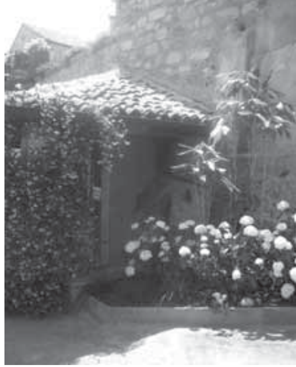
Due immagini dell'allestimento di piazza del Bollo

del portichetto è caratterizzata dalla presenza di numerose graminacee, ancora molto poco conosciute nei nostri giardini.